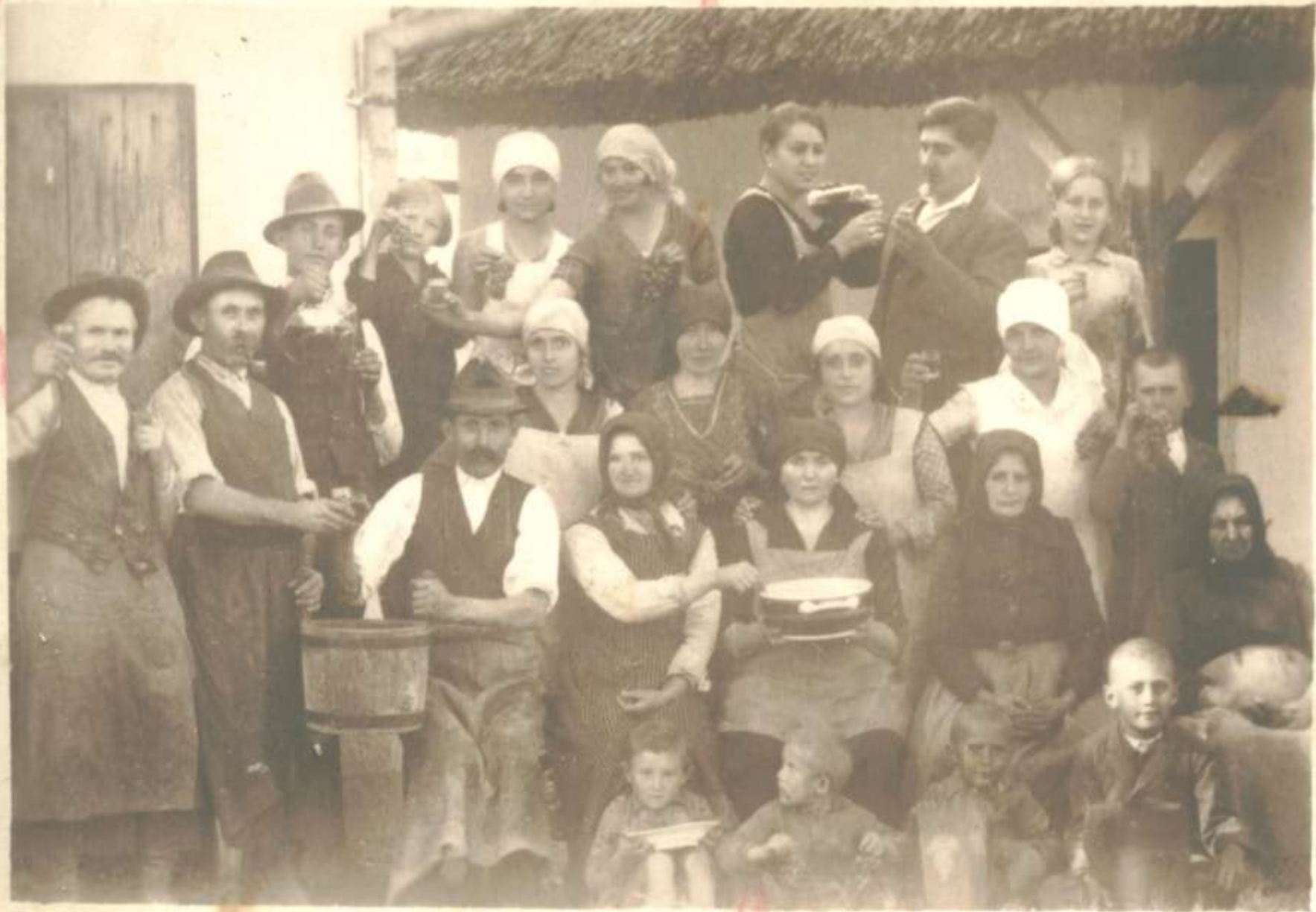
Szüreti csoportkép, Nagy Katalintól