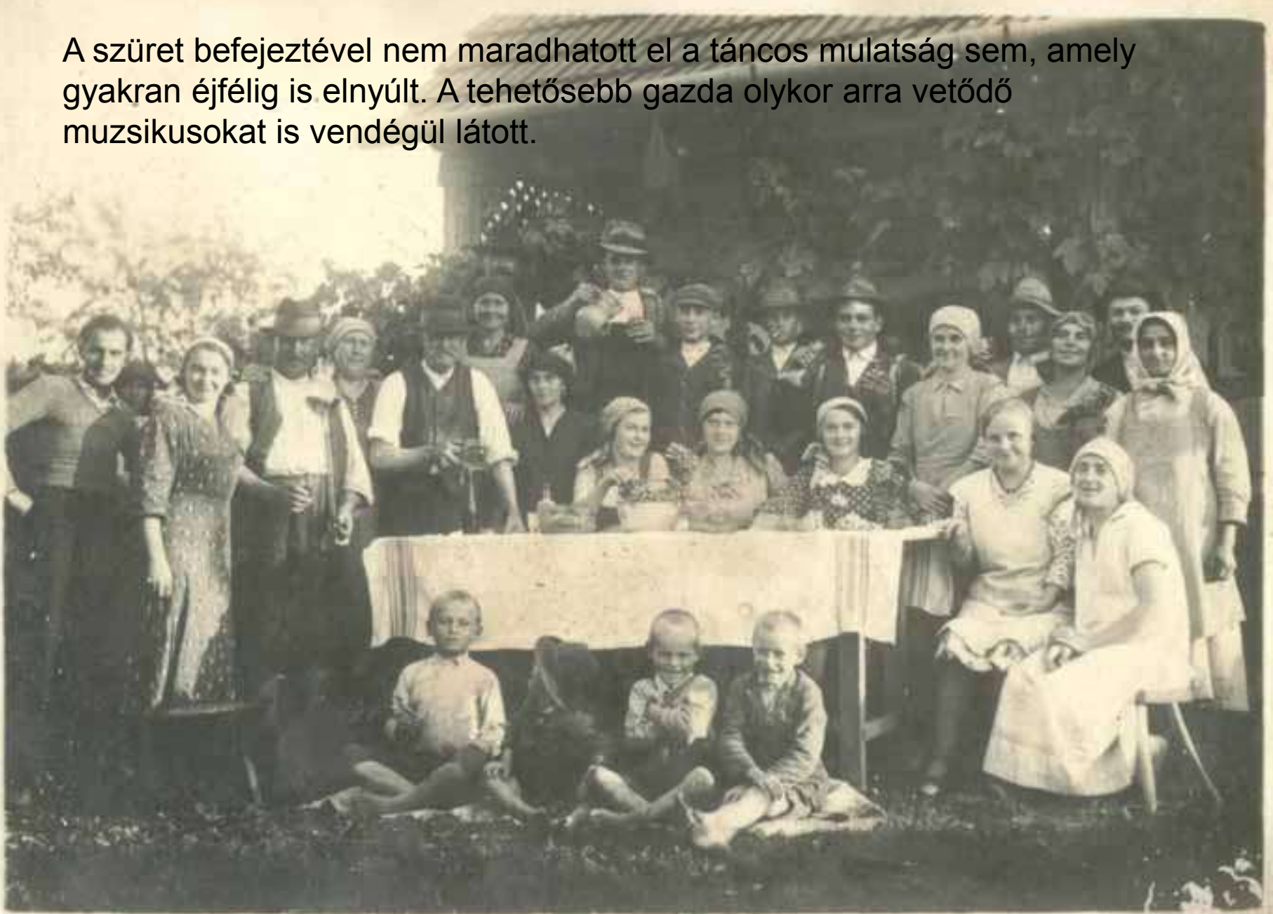
Szüreti csoportkép, Nagy Katalintól

A szüret befejeztével nem maradhatott el a táncos mulatság sem, amely gyakran éjfélig is elnyúlt. A tehetősebb gazda olykor arra vetődő muzsikusokat is vendégül látott.