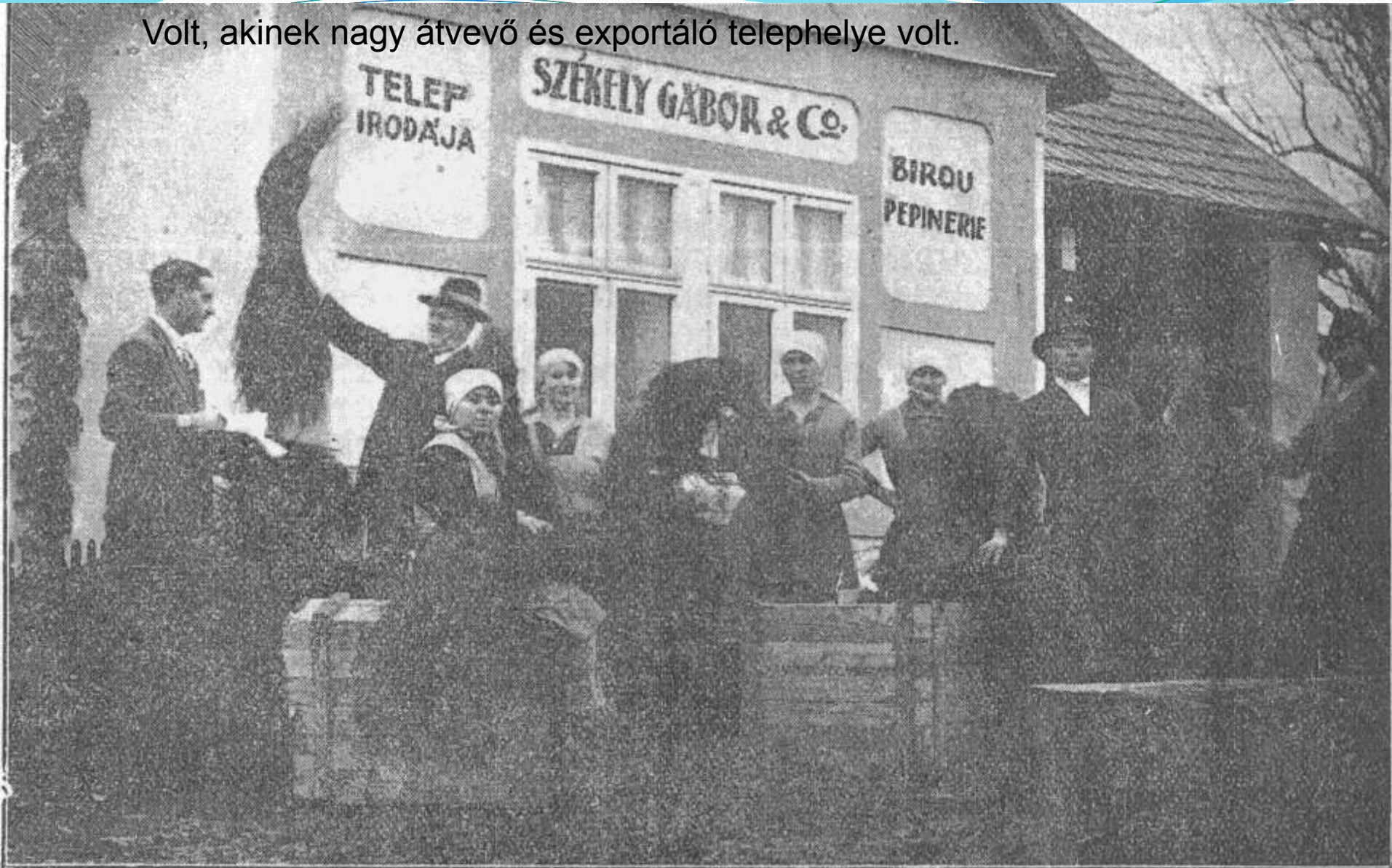
Fotografie originală, vederea în pachetării vițelor de vie și a expedierii.

Volt, akinek nagy átvevő és exportáló telephelye volt.