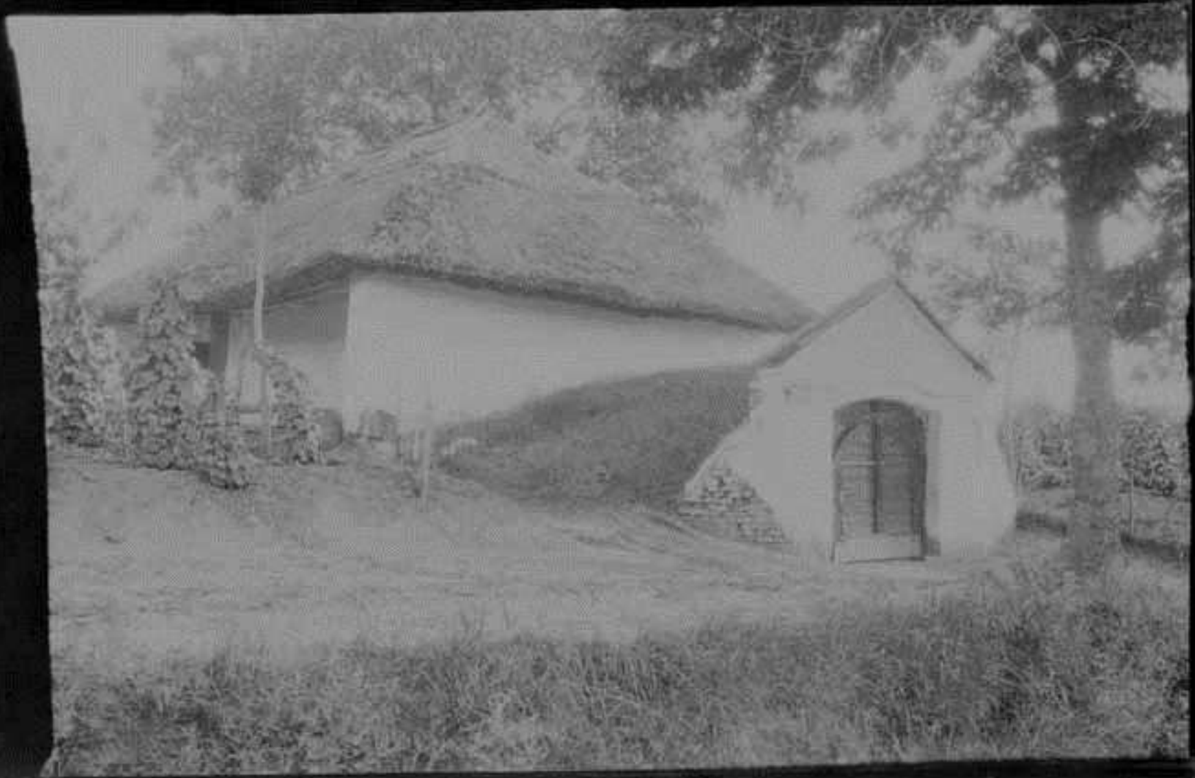
Bihardiószeg, pajtás pincék, Cholnoky Jenő 1913